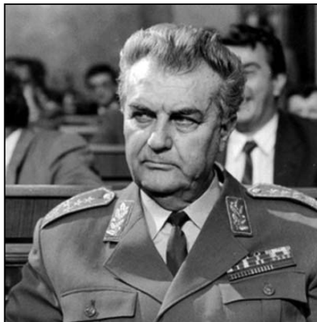
GENERAL VELJKO KADIJEVIĆ

Sindrom gubitnika ponela je i JNA – ona je ubrzano gubila tle pod nogama. General Kadijević je tih dana u telefonskom razgovoru od sovjetskog maršala Jazova tražio direktnu vojnu pomoć, ali je i ovoga puta odgovor bio negativan: Preciznije, ne bi nas mogli zaštititi, a što se oružja tiče može, ali samo redovnim kanalom preko Vlade SFRJ, a mi tražimo mimo vlade, jer nam Ante Marković ometa donošenje odluke vlade. Veljko ga je upozorio da Nemci preko nas ugrožavaju i njih i zamolio da to prenese Gorbačovu. 249