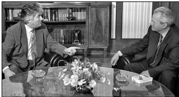
KARADŽIĆ I MILOŠEVIĆ