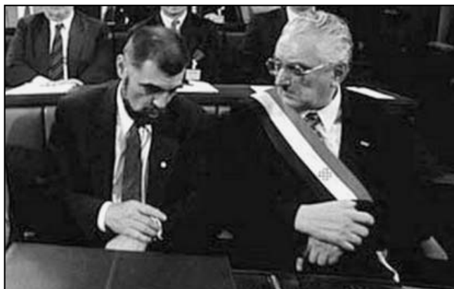
STJEPAN MESIĆ I FRANJO TUĐMAN

U Povelji o pravima Srba zapisano je da je pravedno rešenje pitanja Srba „jedan od važnih čimbenika demokracije, stabilnosti, mira i gospodarskog napretka“. Garantovani su „samoočuvanje i kulturna autonomija“, pravo proporcionalnog učestvovanja u „uvjetima lokalne samouprave i odgovarajućim tijelima državne vlasti“, kao i pravo na „osiguranje gospodarskog i društvenog razvitka radi očuvanja njihova identiteta i radi zaštite od svakog pokušaja asimilacije“. 122 Međutim, Milan Babić je odmah izjavio da odluke Sabora Hrvatske važe samo za „etničke teritorije“ hrvatskog naroda, a nika-