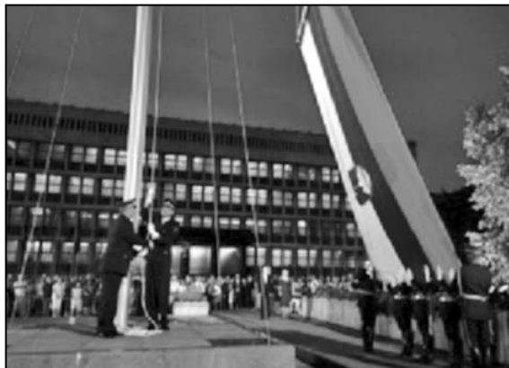
PROSLAVA NEZAVISNOSTI SLOVENIJE

Milan Kučan je u svom govoru, između ostalog, rekao da predloženi ustavni akt i ustavni zakon za njegovo ostvarivanje omogućavaju slovenačkoj državi preuzimanje svih prava i dužnosti čije izvršavanje je, voljom Slovenije, do tada Ustavom iz 1974. godine bilo preneseno