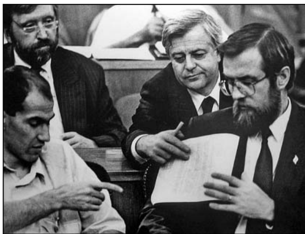
RASPRAVA O BRIONSKOJ DEKLARACIJI, SLOVENAČKI PARLAMENT 10. JUL 1991.

U međuvremenu, Brionska deklaracija je usvojena i na slovenačkom Predsedništvu, koje je preporučilo skupštini Slovenije da je usvoji, što je i učinjeno 10. jula, sa 189 glasova za, 11 protiv i 7 uzdržanih. Na istom zasedanju usvojena je i rezolucija kojom je federaciji i drugim jugoslovenskim republikama predloženo povlačenje JNA iz Slovenije. Slovenačke vlasti su takođe našle načina da izbegnu ili odlože po njih najproblematičnije aspekte sprovođenja Brionske deklaracije, odnosno povlačenje Teritorijalne odbrane sa karaula na granici i drugih vitalnih objekata u republici. Odlagali su predaju zarobljene tehnike, zahtevali su i da se JNA povuče u kasarne po dogovorenim rutama, te da ne dovodi nove jedinice na teritoriju Slovenije. Savezna vlada je, međutim, zahtevala da joj se počnu uplaćivati prihodi od carina, a Sekretarijat za odbranu je čak uputio zahtev da se u vojsku pošalje 4.000 slovenačkih regruta. 278 Savezna vlada i slovenačke vlasti nastavile su sa ratom saopštenjima.