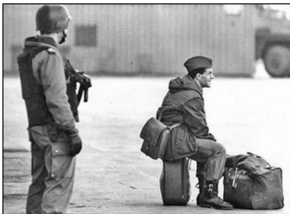
POVLAČENJE JNA, LUKA KOPAR OKTOBAR 1991.

U kasnijim fazama rasplamsavanja jugoslovenske krize, pitanje slovenačkog fijaska neprestano se vraćalo. Tako je Ante Marković 18. septembra 1991. na