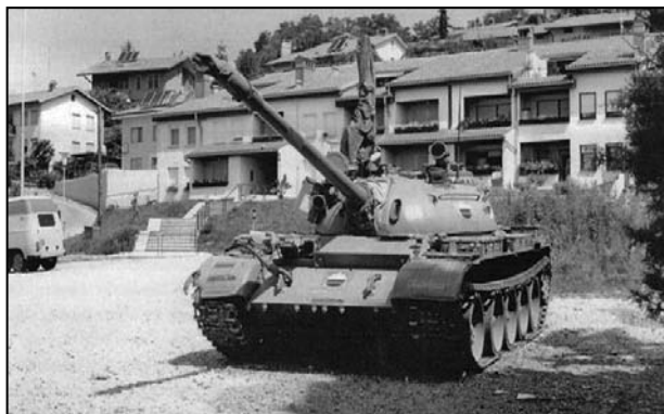
TENK T 55 ZAPLENJEN NA GRANIČNOM PRELAZU ROZNA DOLINA, SA SLOVENAČKIM OZNAKAMA

General Kolšek je i dalje bio protiv punog borbenog angažovanja jer bi to značilo nekontrolisanu eskalaciju sukoba: Značilo bi da smo mi počeli rat. To nikome ne treba. Nisam shvatio saveznog sekretara tako. Naprotiv. Idemo na granicu sa malim snagama da pomognemo saveznoj carini i miliciji da preuzmu granične prelaze. 175 Tako je istovremeno počela i potraga za političkim rešenjem. Federalna vlada je 27. juna od svih „relevantnih političkih faktora“ u Jugoslaviji zahtevala da se na primenu svih političkih odluka koje su donešene u poslednja tri dana proglasi moratorijum u trajanju od tri meseca kako bi se „uspostavilo stanje koje je bilo ranije, pre donošenja odluka i njihovog sprovođenja“. U okviru tog roka trebalo je pronaći „miroljubiva, demokratska i dogovorna“ rešenja o izlasku iz krize i budućnosti zemlje. Marković je ponovo predložio slovenačkoj vladi hitan sastanak, a tražio je i održavanje sednice Predsedništva SFRJ kako bi se razrešila ustavna kriza: Savezno izvršno veće poziva sve građane Jugoslavije da sačuvaju red i mir i time doprinesu razumnom i demokratskom razrešenju krize našeg društva. 176