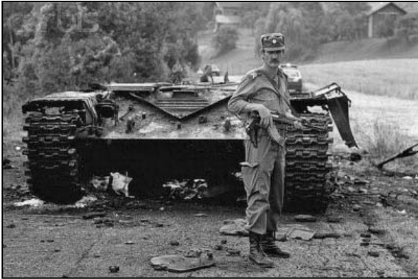
PRIPADNIK TO PORED UNIŠTENOG TENKA

General Kadijević je razgovarao sa Kučanom i uputio službeno pismo slovenačkim vlastima, ali demonstracije sile već je bila potrošen model ponašanja armijskog vrha, a puna upotreba svih kapaciteta bila je nemoguća i u praksi neizvodljiva. Zato je u noći 29/30. juna Skupština Slovenije odbila ultimatum Štaba Vrhovne komande, čak je odala priznanje svim državljanima, pripadnicima TO i policijskih snaga za „hrabru i uspešnu odbranu države“. Skupština je naložila svim državnim organima Republike da dosledno sprovede donesene odluke o osamostaljenju Slovenije. Pokrenut je totalni rat protiv JNA.