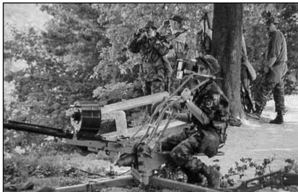
SLOVENAČKA TO NA POLOŽAJU

Janez Drnovšek se povukao iz Predsedništva SFRJ, ali je zamrzao svoju ostavku zbog eventualne potrebe da se u ovom telu nastavi politička aktivnost.