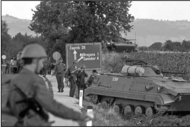
JEDINICE JNA U POKRETU PREMA BREGANI 27.06.1991.

ribor–Dravograd; Karlovac–Ljubljana–Jesenice; Vrhnika–Brnik i Postojna–Ajdovščina–Nova Gorica. Slovenačko rukovodstvo je obavješteno o pokretima JNA. General Kolšek je poslao telegram premijeru Peterleu: Obavještavamo Vas da 5. vojna oblast ima zadatak da preuzme sve granične prelaze i obezbijedi državnu granicu SFRJ. Računamo na suradnju svih organa i građana Republike Slovenije. Zadatak će biti izvršen bezuslovno. Postupit ćemo i po pravilima borbene upotrebe jedinica. Svako otpor bit će slomljen, a sve posljedice snosit će naredbodavci i izvršioci. 164 Vazdušni saobraćaj prema Sloveniji je zatvoren na ljubljanskom aerodromu Brnik i na mariborskom aerodromu, a avioni JNA su u niskom letu nadletali Sloveniju.