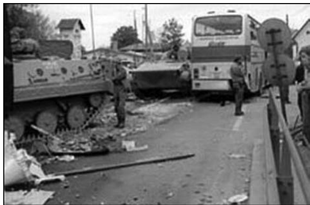
TENK JNA RAZBIJA BLOKADU

Na drugoj strani, iz vojnih objekata i u kasarnama isključena je struja, voda i telefonske linije, a ometano je snabdevanje jedinica hranom. Pripadnici JNA su hapšeni gde god je to bilo moguće. Teritorijalna odbrana je takođe opkolila kasarne JNA i pokrenula niz napada širom Slovenije. U Brniku je napala vojnike JNA