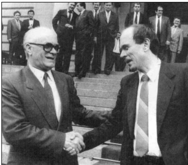
PRIMOPREDAJA DUŽNOSTI PREDSEDNIKA PREDSEDNIŠTVA IZMEĐU RAIFA DIZDAREVIĆA I JANEZA DRNOVŠEKA, 15. MAJ 1989.

Janez Drnovšek je, po rotaciji, izabran za predsednika Predsedništva, a Borisav Jović za potpredsednika. Već njihov prvi sastanak, održan 16. maja, pokazao je dubinu krize u kojoj se našla Jugoslavija i poziciju dve strane. Drnovšek je tražio saglasnost Srbije za amnestiju Janeza Janše, koji je uhapšen zbog „odavanje vojne tajne“ i kome je suđeno na poznatom „procesu četvorici“ pred Vojnim sudom u Ljubljani; tražio je i da Predsedništvo abolira Azema Vlasija, uhapšenog posle demonstracija u Beogradu 28. februara i 1. marta 1989. godine, jer ga je Raif Dizdarević, prethodni predsednik Predsedništva, upozorio na moguće negativno reagovanje svetske javnosti. Drnovšek je hteo i da se razgovara o sudbini proteranih Albanaca sa Kosova. Jović je te predloge odbacio, a njegov komentar odrazio je više nego išta pravce buduće otvorene konfrontacije: Razgovor je pokazao dijapazon problematike koja okupira novoizabranog predsednika Predsedništva: uglavnom kako da se olakša delovanje špijuna, separatista i razbijača Jugoslavije. 23