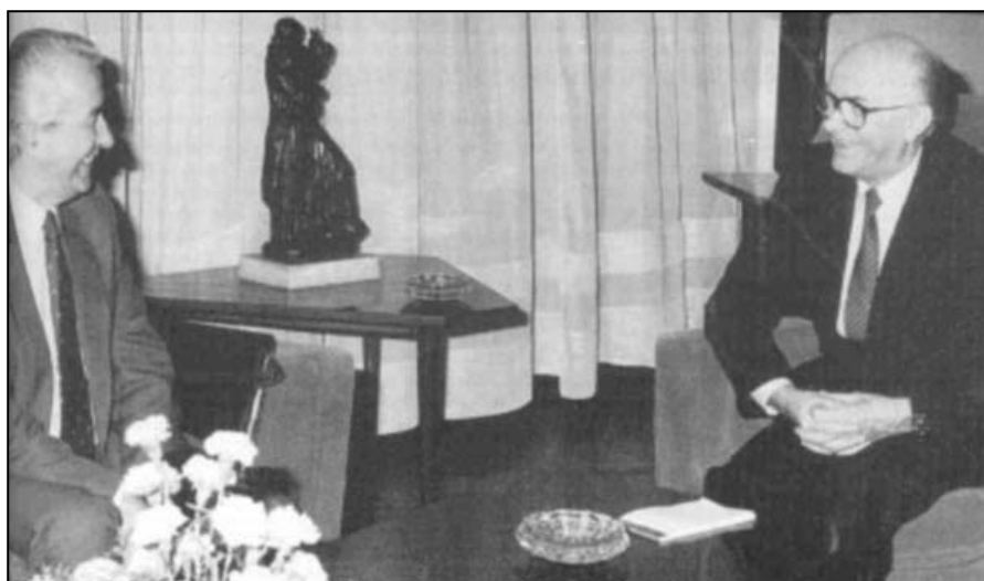
ANTE MARKOVIĆ I RAIF DIZDAREVIĆ, JANUAR 1989.