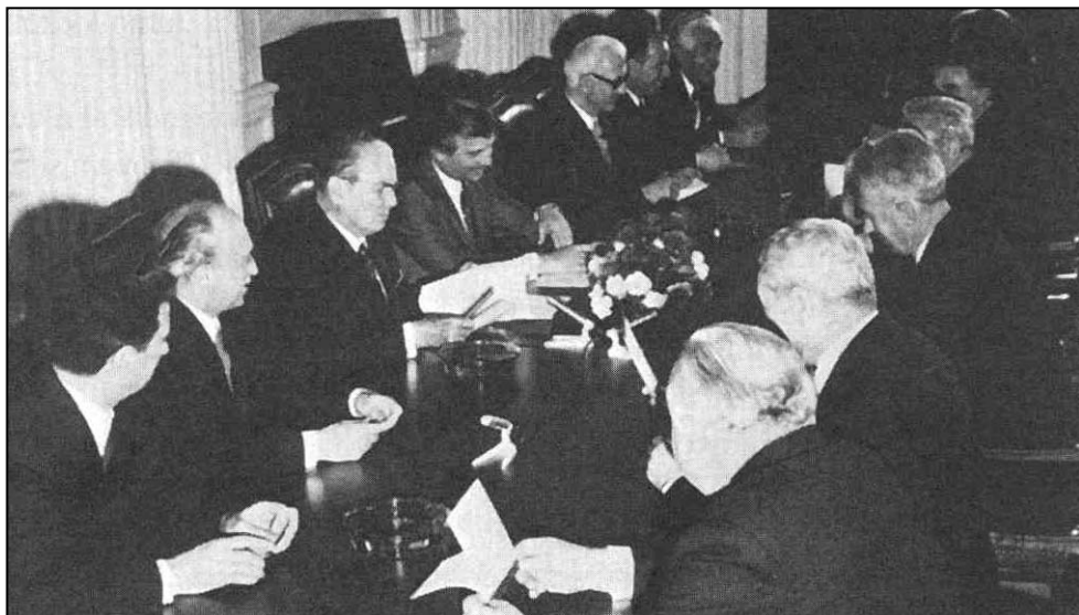
TITO PREDSEDAVA RADOM DRŽAVNOG PREDSEDNITVA 1971.

Predsedništvo od ukupno 23 člana, konstituisano je sredinom 1971. godine pod Titovim predsedavanjem, i za nešto više od dve godine rada održalo je 26 sednica. 12