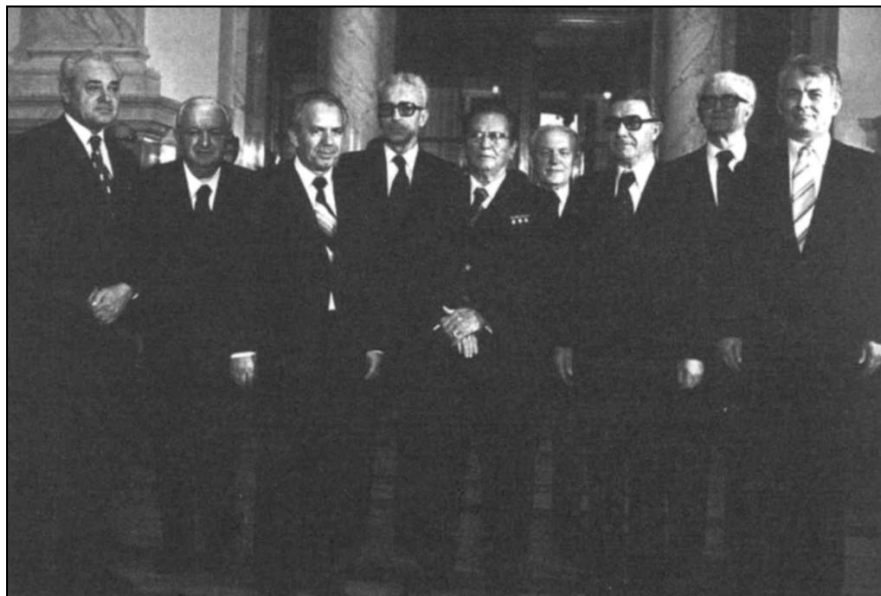
TITO I ČLANOVI DRŽAVNOG PREDSEDNIŠTVA 1975.

Tako je Titova ličnost još jednom uklesana u ustavnu strukturu članom 333 Ustava iz 1974: Polazeći od istorijske uloge Josipa Broza Tita u narodnooslobodilačkom ratu i socijalističkoj revoluciji, stvaranju i razvijanju Socijalističke Federativne Republike Jugoslavije, razvoju jugoslovenskog socijalističkog samoupravnog društva, ostvarivanju bratstva i jedinstva naroda i narodnosti Jugoslavije, učvršćenju nezavisnosti zemlje i njenog položaja u međunarodnim odnosima i u borbi za mir u svetu, a u skladu sa izraženom voljom radnih ljudi i građana, naroda i narodnosti Jugoslavije — Skupština SFRJ može, na predlog skupština republika i skupština autonomnih pokrajina, izabrati Josipa Broza Tita za Predsednika Republike bez ograničenja trajanja mandata. Neophodna tranzicija obezbeđena je članom 328 koji je predviđao da prestankom funkcije predsednika Republike, Predsedništvo SFRJ vrši sva prava i dužnosti koje ima prema ovom ustavu, a potpredsednik Predsedništva SFRJ postaje predsednik Predsedništva SFRJ do isteka mandata za koji je izabran za potpredsednika. 14