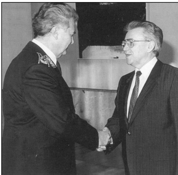
VELJKO KADIJEVIĆ I BORISAV JOVIĆ

varijante i analize. Pitao je samo da li će Armija zaštititi vlast u Srbiji ako opozicija ponovo počne sa nasiljem. Odgovorili su da hoće. Pitanje je da li im se i to može verovati. 167