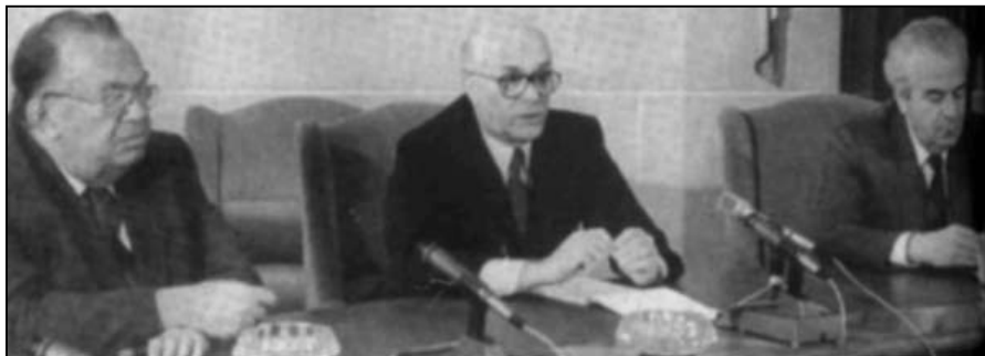
PRIMOPREDAJA DUŽNOSTI PREDSEDNIKA PREDSEDNIŠTVA IZMEĐU LAZARA MOJSOVA I RAIFA DIZDAREVIĆA, 15. MAJ 1988.

U trećem sastavu Predsedništva (1985–1989) članovi su bili: Veselin Đuranović (Crna Gora), Radovan Vlajković (Vojvodina), Sinan Hasani (Kosovo), Lazar Mojsov (Makedonija), Branko Mikulić, pa Hamdija Pozderac, pa Raif Dizdarević (Bosna i Hercegovina), Stane Dolanc (Slovenija), Josip Vrhovec (Hrvatska) i Nikola Ljubičić (Srbija). U ovom mandatu ispred SKJ u Predsedništvu su bili Ali Šukrija, Vidoje Žarković, Milanko Renovica, Boško Krunic i Stipe Šušvar do novembra 1988. godine, kada je novim ustavnim amandmanom ukinuta ova pozicija. Ostalo je ostalo isto – Predsedništvo su činila osmorica članova sa petogodišnjim mandatom – predstavnici federalnih jedinica (šest republika i dve pokrajine). U ovom periodu predsedavali su Veselin Đuranović (Crna Gora, predsednik od 1984. do 1985), Radovan Vlajković (Vojvodina, predsednik od 1985. do 1986), Sinan Hasani (Kosovo, predsednik od 1986. do 1987), Lazar Mojsov (Makedonija, predsednik od 1987. do 1988) i Raif Dizdarević (BiH, predsednik od 1988. do 1989).