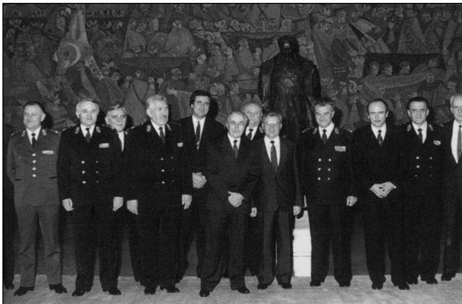
DRŽAVNO RUKOVODSTVO I ARMIJSKI VRH 1990.