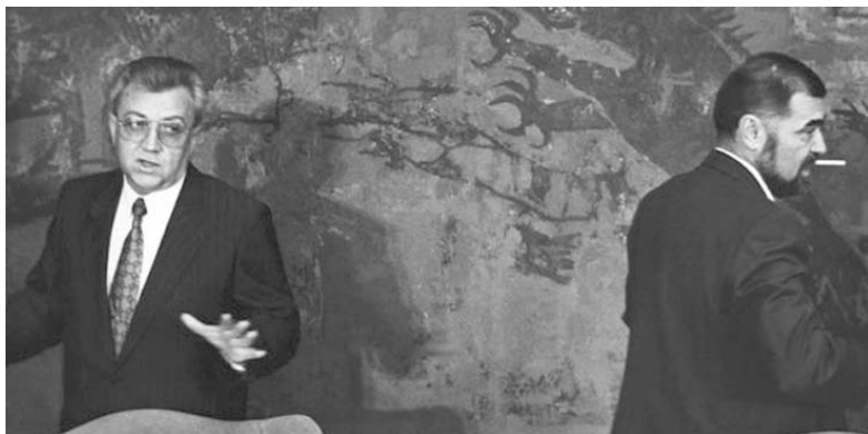
BORISAV JOVIĆ I STJEPAN MEŠIĆ SUKOBLJENI NA SEDNICI PREDSEDNIŠTVA