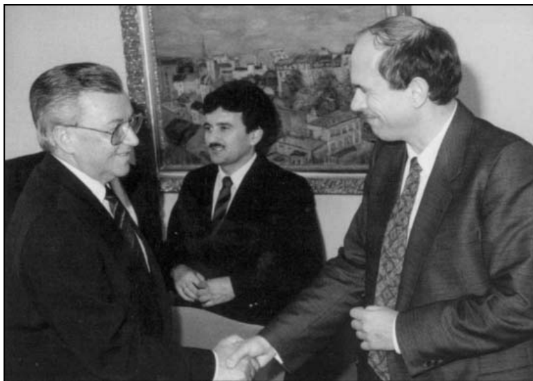
BORISAV JOVIĆ PREUZIMA DUŽNOST PREDSEDNIKA PREDSEDNIŠTVA SFRJ OD JANEZA DRNOVŠEKA, 15. MAJ 1990.

Sednice ovog saziva od samog početka poprimile su konfliktni tok. Rasprave su postajale žustre, prvi put su se čuli otvoreno disonantni tonovi. Nije se više samo potvrđivalo na partijskim forumima usaglašeno stanovište, već su se kristalisali različiti interesi, pojavljivala razlika u mišljenjima i glasanju. Preglasavanje, koje je predstavljalo retkost u ranijem radu Predsedništva, postalo je sve učestalije. Otud su i proceduralna pitanja rada Predsedništva, definisana Poslovnikom o radu iz 1984. godine, od formalnosti prerasla u značajan faktor koji je uticao na dinamiku rada. 28