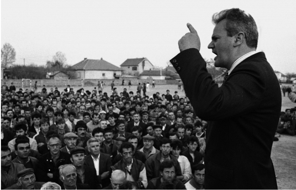
Слободан Милошевић у Косову Пољу 20. априла 1987.