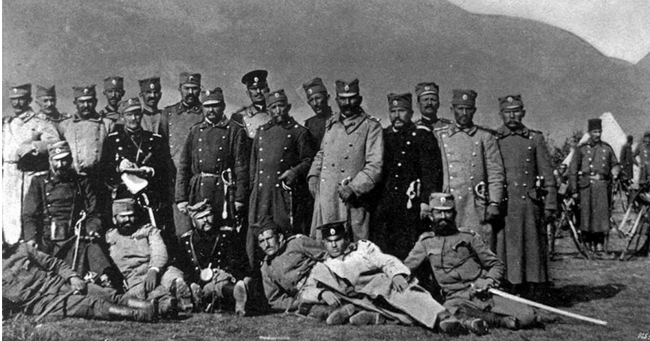
Српски официри у Пећи

Присаједињењем Косова и Метохије Краљевини Србији и Краљевини Црној Гори, Албанци (Арбанаси) нашли су се у саставу словенских држава, а не у саставу „Велике Албаније“, што је био основни циљ њиховог националног покрета још од 1878. године (Прва призренска лига). Велики део албанске популације долазак српске и црногорске војске дочекао је као окупацију, а не као ослобођење од турске власти.