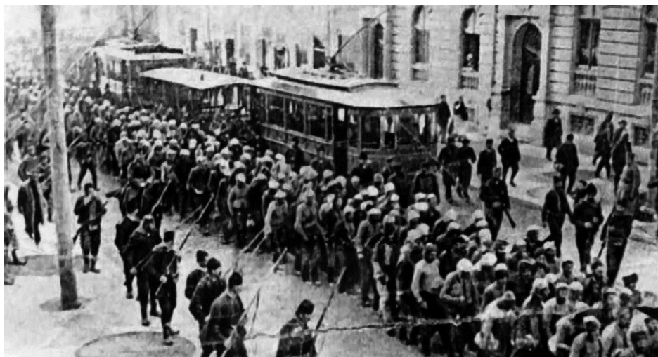
Албански заробљеници у Београду 1912

Примирје с Турском закључено је 3. децембра 1912, када су у Лерин ушле српске а сутрадан грчке трупе. Истовремено су у Лондону почеле припреме за Конференцију мира, а упоредо с њом и конференцију амбасадора великих сила од којих је Турска тражила посредовање. Иако су биле неутралне, велике силе нису хтеле да дозволе једнострану промену равнотеже моћи. Конференција амбасадора је одлучила да се створи аутономна Албанија „под искључивом гаранцијом и надзором Великих сила и суверенитетом или сизеренством султановим“. На предлог руског амбасадора одлучено је и о границама Албаније са севера и југа (због Србије и Грчке), док је остало питање источне границе. Конференција мира прекинута је због наставка непријатељстава, а затим је настављена и завршена потписивањем Уговора о миру балканских савезника с Турском 30. маја 1913. Турска је уступила балканским државама све територије у Европи западно од линије Енос (на Јегејском мору) – Мидија (на Црном мору) изузев Албаније чиме су прихваћене одлуке амбасадора. Сва остала питања уредиће се посебним уговорима. 11