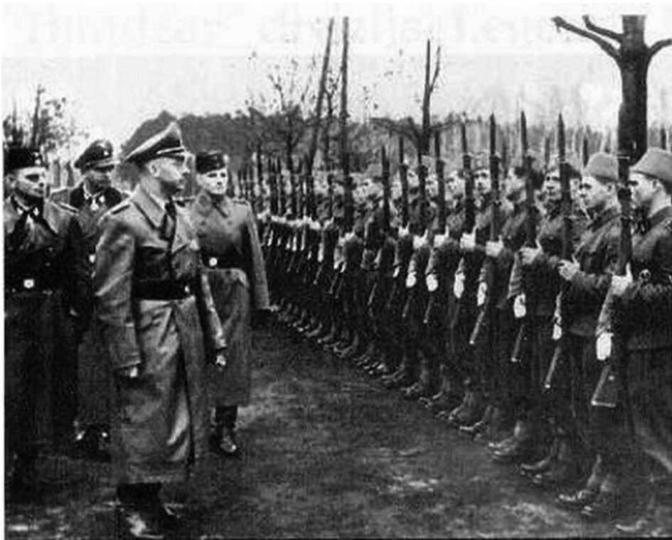
Албанска СС дивизија „Скендербеј“

У наредном периоду ситуација је била потпуно иста и отишло се још даље у попуштању албанском национализму. После капитулације Италије, на целој територији Космета није разоружан ниједан италијански војник. Зато је требало нешто хитно предузети. У резолуцији Покрајинског саветања КПЈ за Космет новембра 1943. промењено је чак и име партијске организације – уместо српског „Метохија“ стављено је албанско име „Дукаћин“ јер народ „тако зове ту област“. То име обухватало је, међутим, и добар део северне Албаније. Промена је била везана за формирање народноослободилачких одбора као органа нове власти. Тада је закључено и да се сазове шира конференција ради стварања заједничког народноослободилачког одбора за читаво „Косово и Дукаћин“, што је био акт од непосредног државно-правног значаја за пројектовани будући статус ове области.