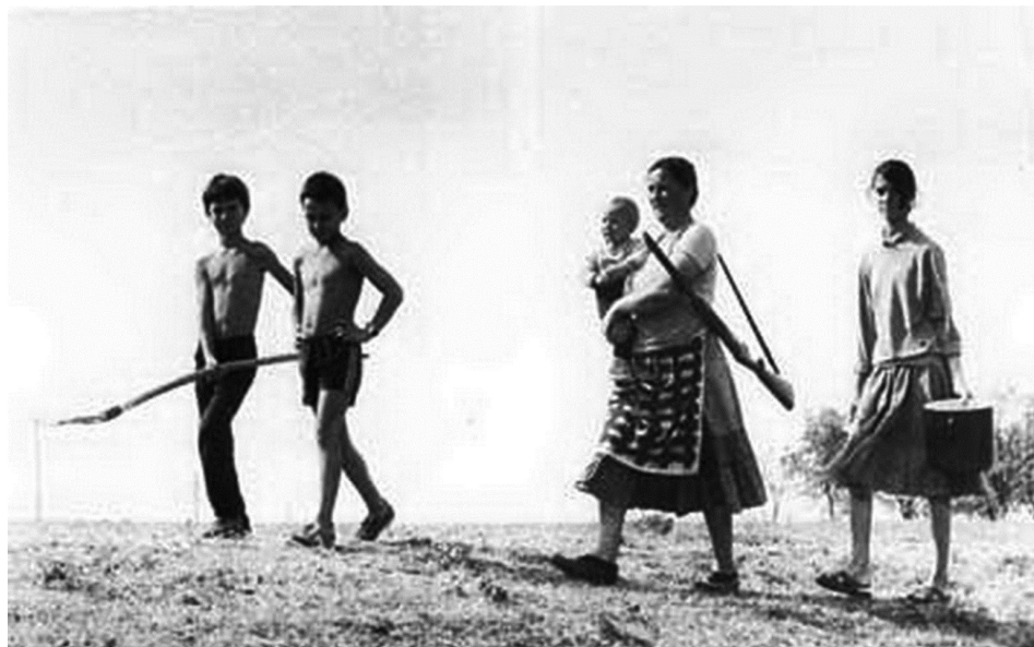
Једна српска породица у селу Прекале

ру српског национализма организовану из Београда. На тај начин свесно су искључени стварни и дубински разлози који су довели до протеста и покушаја самоорганизовања српског и црногорског живља на Косову“. 208