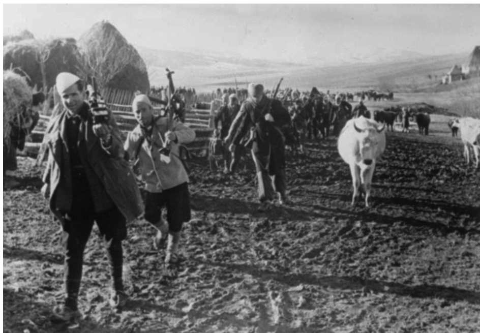
Албанске јединице орјанизоване од Немаца за борбу против партизана

Конференција је одржана, али не на југословенској територији већ у Албанији, у селу Бујану, од 31. децембра 1943. до 2. јануара 1944. јер на Косову и Метохији једноставно није било слободне територије на којој би се одржала једна таква конференција. Национални састав делегата није одговарао националном саставу становништва. Састав је био двојако нарушен: конференцији су као делегати присуствовали и Албанци који нису били југословенски држављани, нити су икада живели на југословенској територији. Од укупно 51 делегата, таквих је било 10, а укупно је било свега 7 Срба и Црногораца, што није одговарало тадашњем саставу становништва. 51