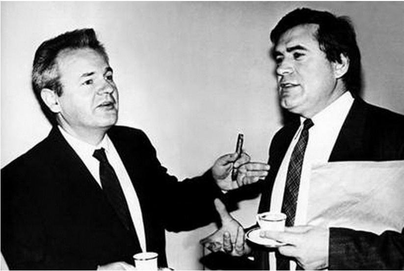
Слободан Милошевић и Азем Власи

Тражено је посебно ангажовање комуниста у органима унутрашњих послова и правосуђа, како би се радикално побољшао рад на заштити основних права и слобода грађана: „Само усјешним решавањем свакодневних животињих проблема, у свакој средини, пре свега личним ангажовањем чланова СК у радним организацијама, месним заједницама, у организацијама власити и самоуправљања, у школама и на факултетима, међу младима, на линији јачања узајамног поверења, међу људима различитих националности, шириће се фронт противресивних снага и брже ће се преовладавати појаве подвајања на националној основи“. 8