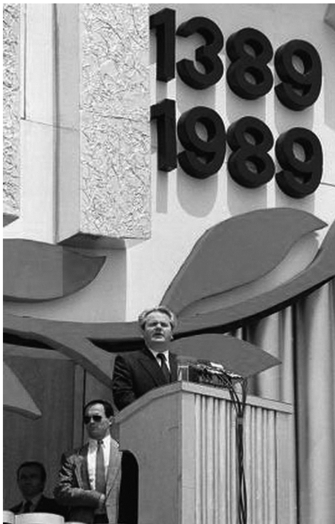
Слободан Милошевић на Газимештану 1989

а да је он њен неприкосновени господар. Тај ритуал доживљен је као „враћање достојанства“ целом народу, а Милошевић је свакако био свестан позитивног политичког потенцијала трансфера емоција са централних симболе на оне особе које се са њима повезују, односно са којима се манипулише. Тако је Милошевић у епохи рушења комунизма заштитио сопствену позицију „подизањем једног новог етеричног зида од традиционалних симбола и националних митова“. 473