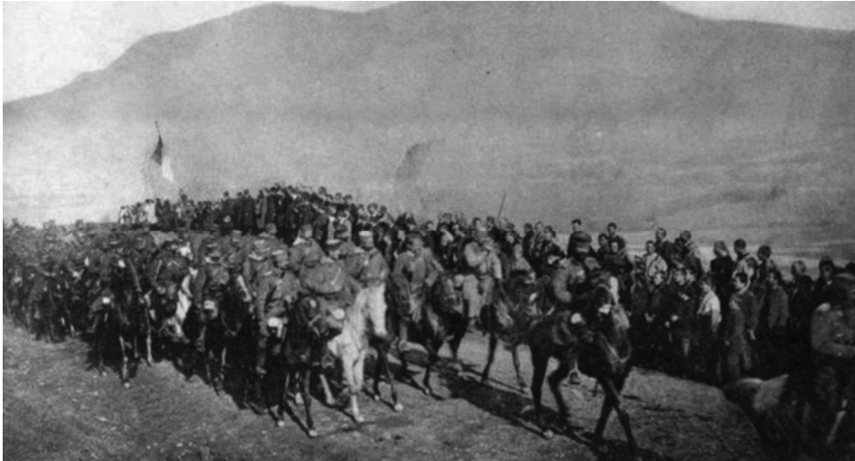
Косовска Мишковица 1912

схваћали као вршење светије дужности. И док још није био објављен рат, у народу је владала нека свечана атмосфера, као пред неки велики догађај који ће донети спасење свима“. 7