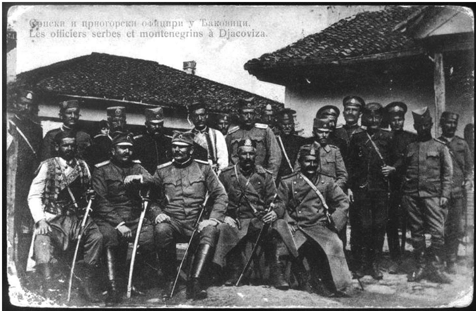
Српски и црногорски официри у Ђаковици