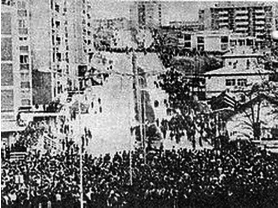
Албанске демонстрације у Приштини 1981

То је један од разлога што је СК Косова скоро излазио из опортунистичке позиције“. 87