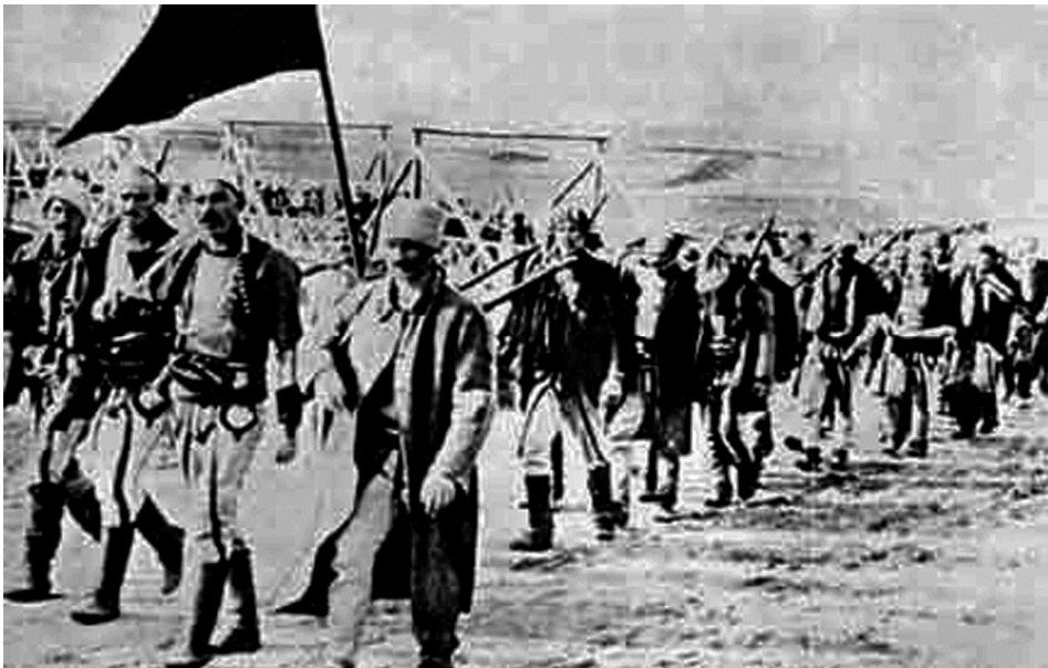
Повлачење албанских добровољаца са Косова 1912

Тако је Косово и Метохија трајно престало да буде под управом Отоманског царства и постало је саставни део модерне српске државе, изузев малог дела који је био под суверенитетом Црне Горе. То је потврђено, осим уговором из Лондона, и Букурештанским уговором од