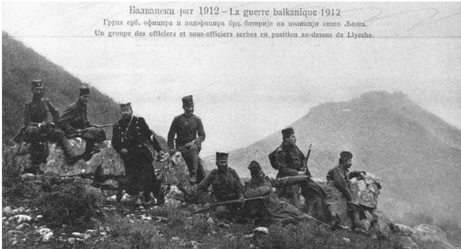
Српска војска у Албанији 1912