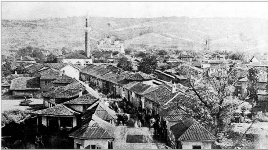
Прилог 1. Ниш после ослобођења 1878. године

Нишка подружина је временом почела да стиче леп углед. Од 1881. године чланице су основале фонд за подизање школе и цркве у Александрову на Мрамору, 4 а од 1883. до 1886. су издржавале једног питомца, сина свештеника који је погинуо у рату, кога су после гимназије послале у Београд, у Богословију. Прекретницу у раду подружине означило је оснивање занатске школе за девојчице. Школа је основана по угледу на Раденичку школу у Београду и у почетку су уписиване само сиромашне девојчице које су је похађале бесплатно. Уз то су им чланице друштва набављале одећу и обућу, а од треће године школовања ученице су добијале и део зараде која је остварена од продаје сашивеног рубља и хаљина. Успешан рад подружине и школе зауставио је Српско-бугарски рат 1885/86. године. Чланице су почеле да раде у болницама, а једну, са 35 кревета, саме су опремиле свим потребним стварима, постељином и санитетским материјалом. 5