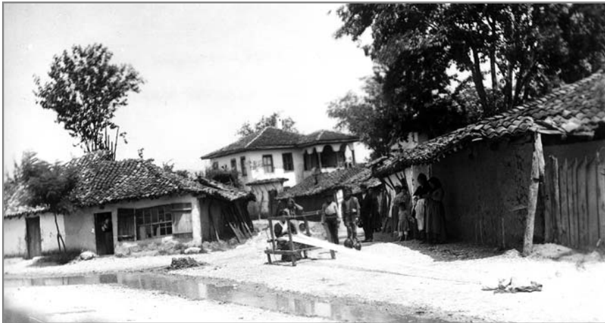
Прилог 2. Улица у Нишу, припрема потке за ткање, 1890. године