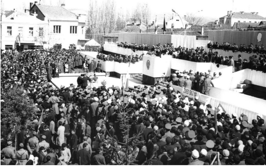
Посета Јосипа Броза Тита Косову и Метохији. Велики митинг у Приштини. Говор председника СФРЈ Јосипа Броза Тита, 26. март 1967 (МЈ, 1967-328-182)