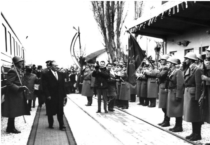
Посета Јосипа Броза Тита Косову и Метохији. Дочек у Косовској Митровици, 25. март 1967.