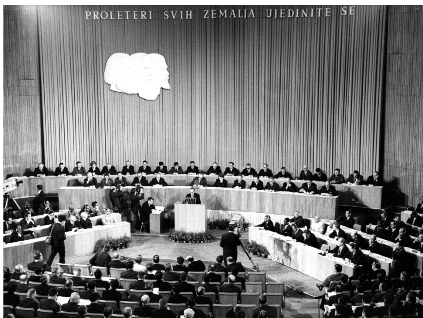
Девети конгрес Савеза комуниста Југославије. Јосип Броз Тито подноси реферат, Београд, 11. март 1969