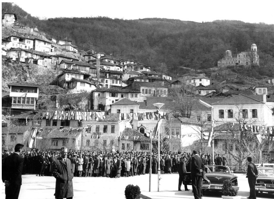
Посета Јосипа Броза Тита Косову и Метохији. Панорама Призрена, 27. март 1967.