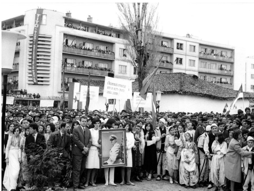
Посета Јосипа Броза Тита Косову и Метохији. Говор председника СФРЈ Јосипа Броза Тита у Ђаковици, 27. март 1967 (МЈ, 1967-329-182)