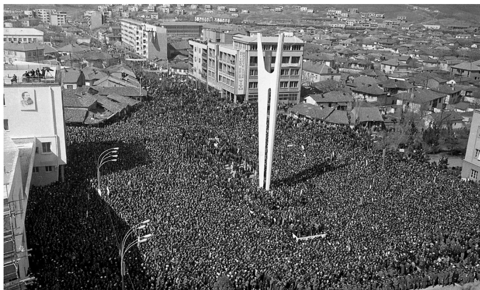
Посета Јосипа Броза Тита Косову и Метохији. Велики митинг у Приштини Говор председника СФРЈ Јосипа Броза Тита, 26. март 1967. (аутор Стеван Крагујевић, МЈ, СК-5-А-10; МЈ, СК-5-А-13)