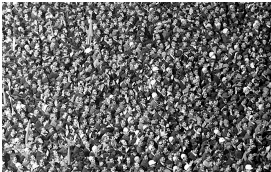
Посета Јосипа Броза Тита Косову и Метохији. Велики митинг у Приштини. Говор председника СФРЈ Јосипа Броза Тита, 26. март 1967. (аутор Стеван Крагујевић, МЈ СК-5-А-4)