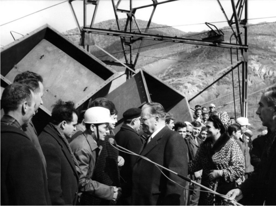
Посета Јосипа Броза Тита Косову и Метохији. Долазак у Звечан, 25. март 1967. (МЈ, 1967-328-085)