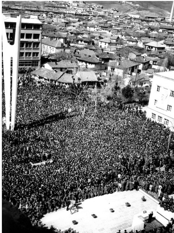
Посета Јосипа Броза Тита Косову и Метохији. Велики митинг у Приштини. Говор председника СФРЈ Јосипа Броза Тита, 26. март 1967 (МЈ, 1967-328-177)