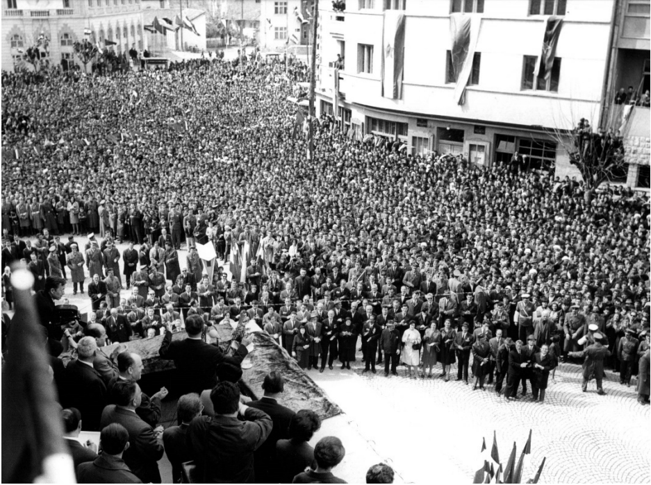
Посета Јосипа Броза Тита Косову и Метохији. Говор председника СФРЈ Јосипа Броза Тита у Пећи, 28. март 1967