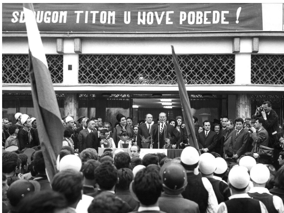
Посета Јосипа Броза Тита Косову и Метохији. Говор председника СФРЈ Јосипа Броза Тита у Ђаковици, 27. март 1967