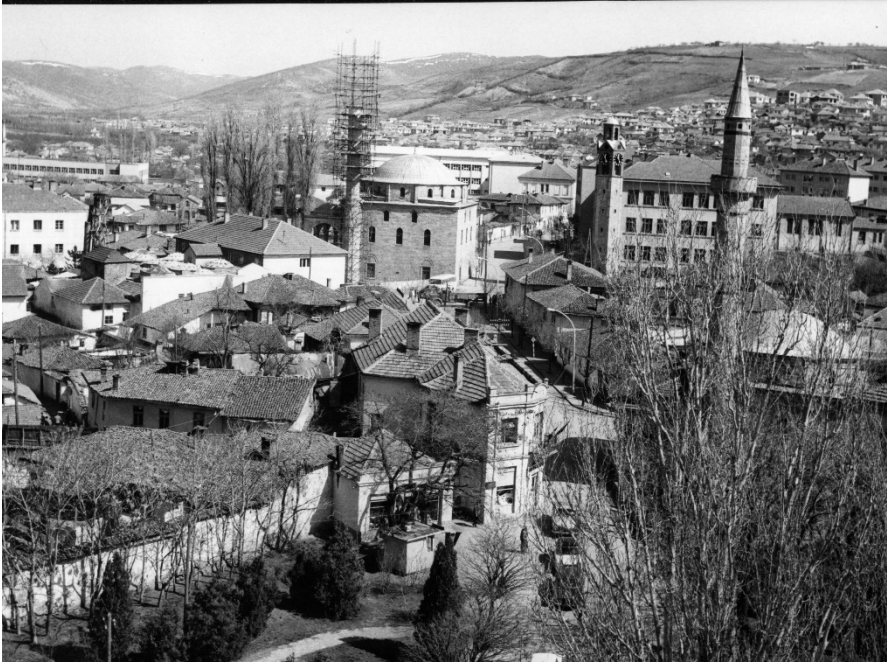
Посета Јосипа Броза Тита Косову и Метохији. Панорама Приштине, 26. март 1967