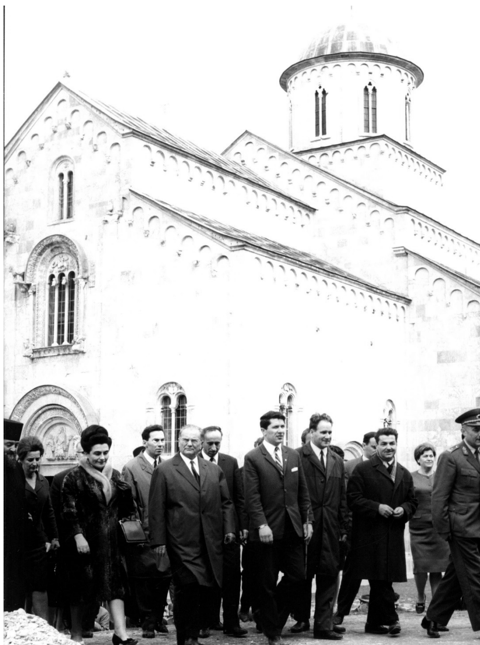
Посета Јосипа Броза Тита Косову и Метохији. Разгледање српског манастира Високи Дечани, 28. март 1967 (МЈ, 1967-330-109)