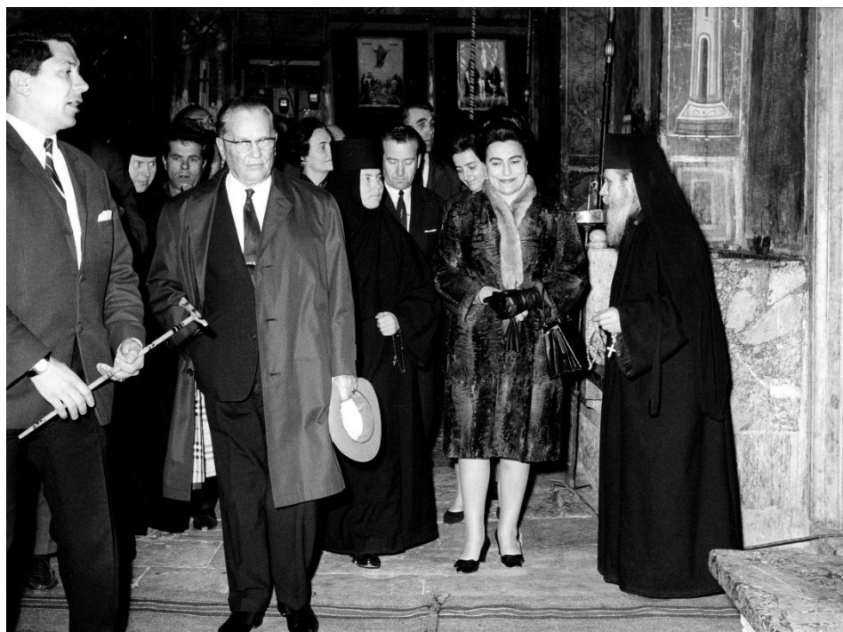
Посета Јосипа Броза Тита Косову и Метохији. Разгледање српског манастира Пећке патријаршије, 28. март 1967 (МЈ, 1967-330-027)