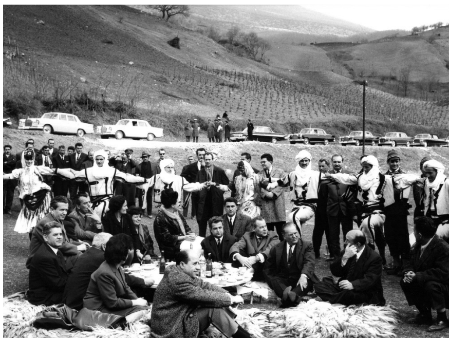
Посета Јосипа Броза Тита Косову и Метохији. Обилазак Руговске клисуре, 28. март 1967 (МЈ, 1967-330-050)