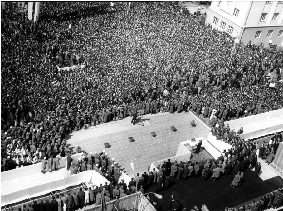
Посета Јосипа Броза Тита Косову и Метохији. Велики митинг у Приштини. Говор председника СФРЈ Јосипа Броза Тита, 26. март 1967 (МЈ, 1967-328-183)