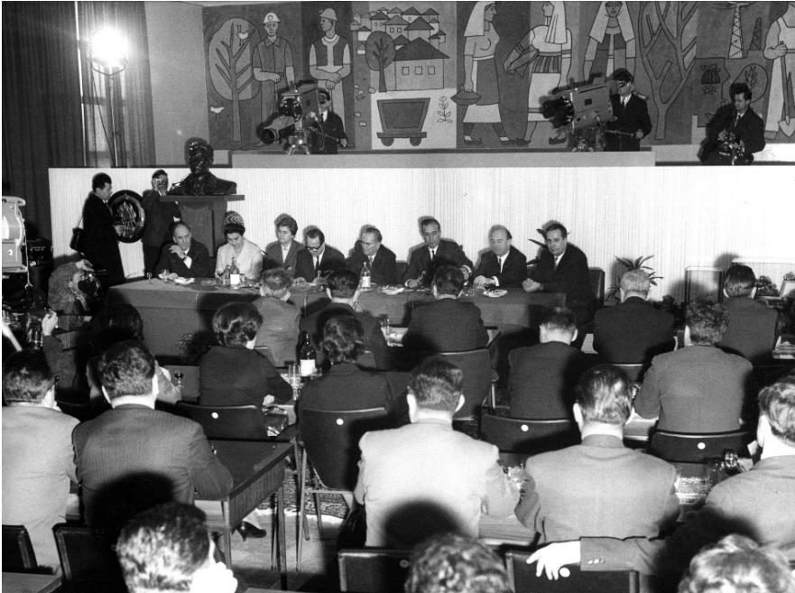
Посета Јосипа Броза Тита Косову и Метохији. Разговор са представницима радних колектива у ресторану друштвене прехране у Трепчи, 25. март 1967. (МЈ, 1967-328-100)