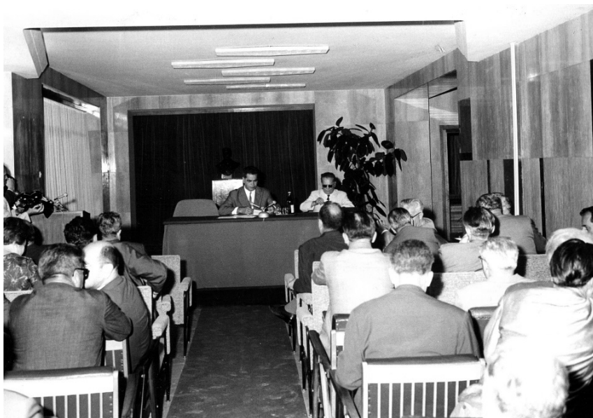
Четврти пленум ЦК СКЈ (Брионски пленум) за време заседања, Бриони, 1. јул 1966, на челу сале за столом Вељко Влаховић и Јосип Броз Тито