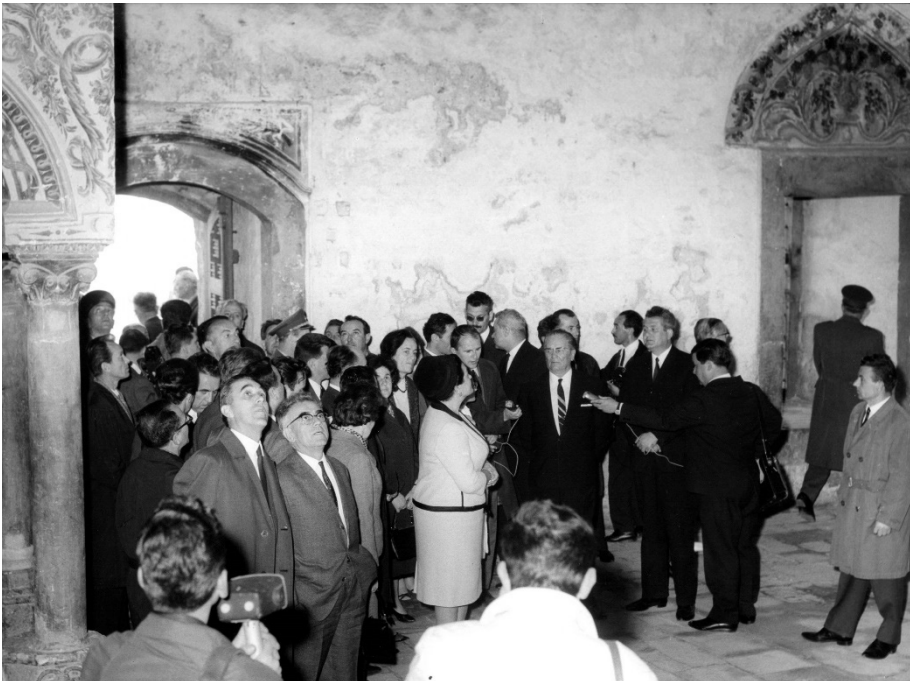
Посета Јосипа Броза Тита Косову и Метохији. Разгледање Синан Пашине џамије, Призрен, 27. март 1967