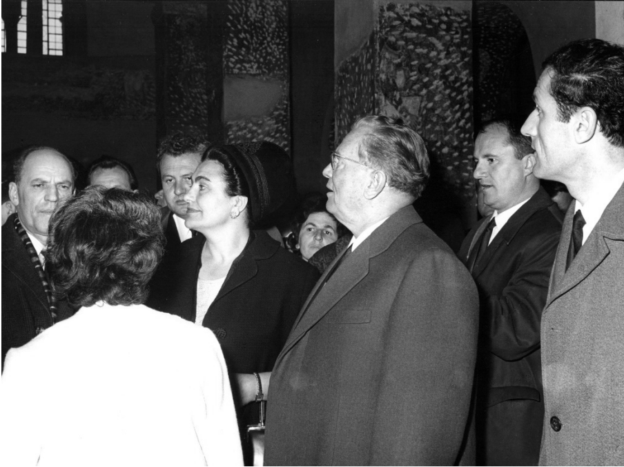
Посета Јосипа Броза Тита Косову и Метохији. Разгледање српске цркве Богородице Љевишке, Призрен, 27. март 1967