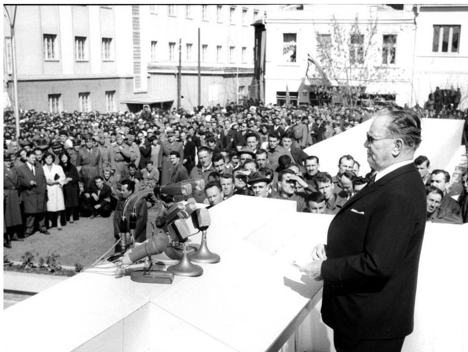
Посета Јосипа Броза Тита Косову и Метохији. Велики митинг у Приштини. Говор председника СФРЈ Јосипа Броза Тита, 26. март 1967. (МЈ, 1967-328-186)