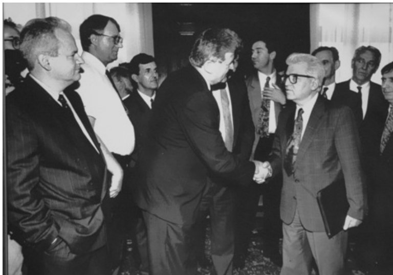
Dobrača Čosić sa jugoslovenskim rukovodstvom posle izbora