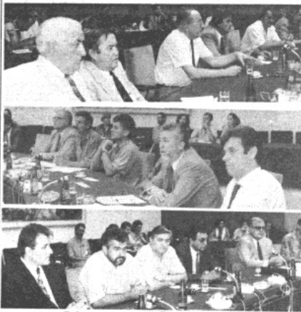
Са учесничког састанка у Палати федерације