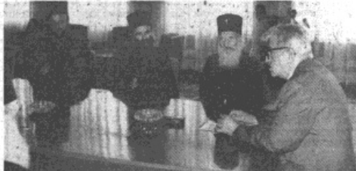
Добрица Ћосић у разговору са делегацијом СПЦ коју је предводио патријарх Павле