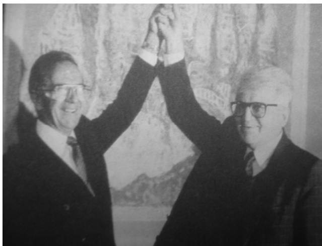
Milan Panić i Dobrica Ćosić u javnoj manifestaciji saradnje

Miloševiću je, međutim, ubrzo ispostavljena cena ovog manevra. „Doleteo je Panić. Lep, srdačan, hitar, nesmirljiv čovek. Prebrz za političara. Izjave su mu spontane i personalne. Ne zna gde je došao i šta ga čeka. Doneo nam je vedrinu, samopouzdanje, nadu i smeh, na koje smo zaboravili posle Titove smrti. Valjda i racionalnost i efikasnost koje nemamo. Ako ga Amerikanci nisu opremili svojim idejama, verujem da ću uspeti da saradujem sa čovekom – „biznismenom“, iako su ti ljudi van mog iskustva“. 12